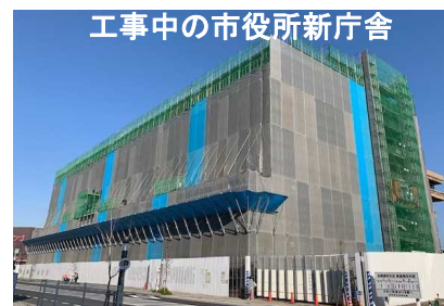
工事中の市役所新庁舎